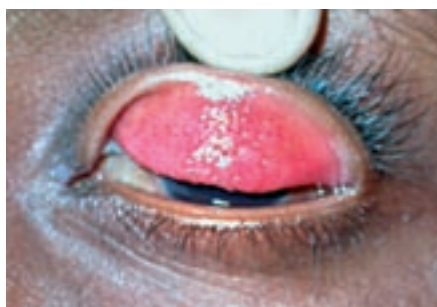
Figure 5 : L'éversion de la paupière supérieure montre la présence de papilles conjonctivales marquées, dans le cas d'une limbo-conjonctivite endémique tropicale ou kérato-conjonctivite vernale

On ne connaît pas la cause d'une limbo-conjonctivite endémique tropicale, mais cette affection est souvent associée à de l'asthme et de l'eczéma et est probablement due à une réaction allergique de longue date. Ce type de conjonctivite se déclare générale-