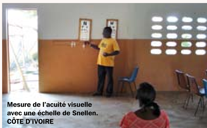
Mesure de l'acuité visuelle avec une échelle de Snellen. CÔTE D'IVOIRE