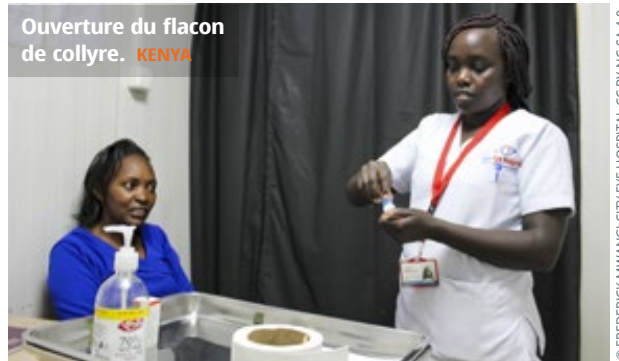
Ouverture du flacon de collyre. KENYA