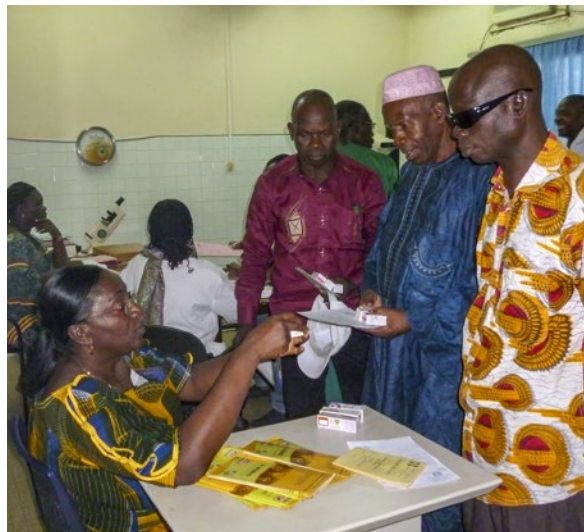
Il faut parler aux patients de leurs médicaments et leur expliquer comment les administrer. CÔTE D'IVOIRE

Il faut se débarrasser des médicaments périmés en toute sécurité, de préférence en les rapportant à la pharmacie. Prévenez les patients sous traitement pour une maladie chronique ou à long terme qu'ils doivent renouveler leur ordonnance seulement lorsque c'est nécessaire . S'ils achètent en une seule fois plusieurs mois de traitement, certains des médicaments risquent de se périmé avant que le patient puisse les utiliser.