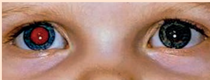
L'absence de reflet pupillaire est anormale et peut être le signe d'une maladie oculaire grave