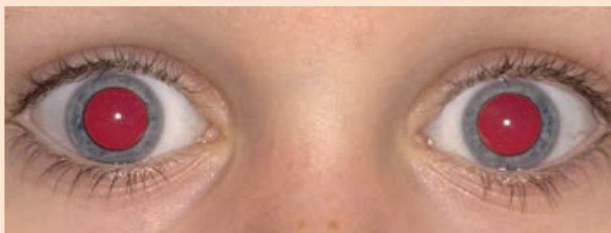
Le reflet pupillaire doit être identique dans les deux yeux