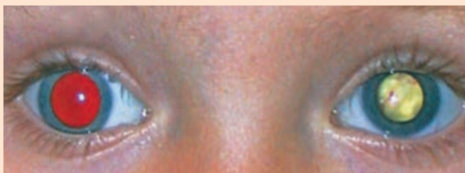
Une couleur ou luminosité anormale du reflet pupillaire peut indiquer la présence d'une maladie oculaire grave