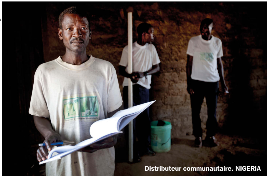
Distributeur communautaire. NIGERIA

traitements de chimiothérapie préventive par an dans le monde.